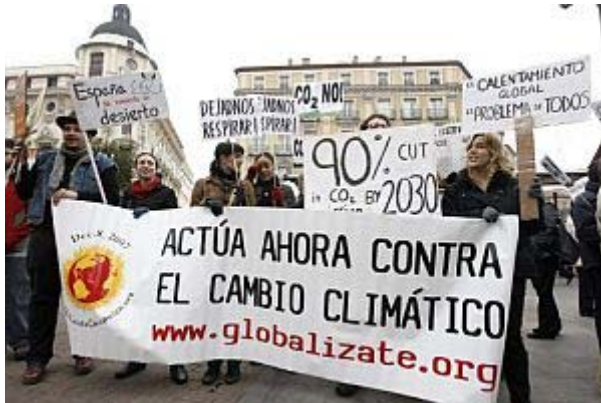
Imagen de la manifestación, en la Plaza de Jacinto Benavente de Madrid.